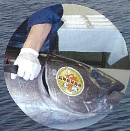
マグロの解体ショー